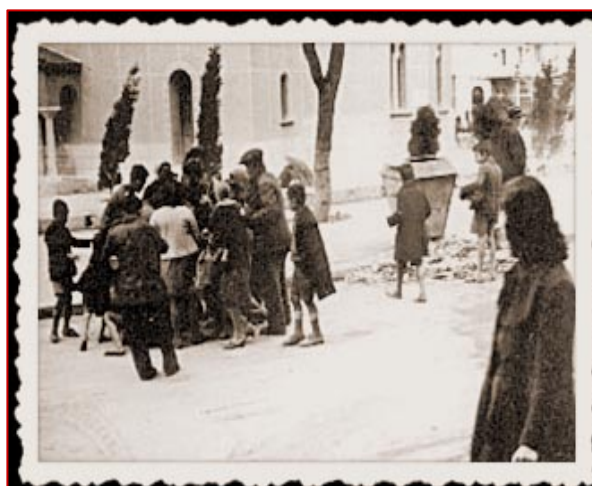
Κατοχή, Αθήνα. Περστικοί βοηθούν άνθρωπο που σωριάστηκε από την πείνα (Φωτογραφικό Αρχείο Ιστορικής και Εθνολογικής Εταιρείας της Ελλάδος).

τον πρώτο χρόνο (1941-1942) πέθαναν χιλιάδες άνθρωποι. Οι κατακτητές άρπαξαν από τη χώρα ό,τι τους ήταν χρήσιμο για τον πόλεμο που συνέχιζαν με άλλες χώρες (Β' Παγκόσμιος Πόλεμος): τρόφιμα, πρώτες ύλες από τα εργοστάσια, μεταφορικά μέσα και καύσιμα, χρήματα. Η ναζιστική ιδεολογία των Γερμανών στηριζόταν στο ρατσισμό, θεωρούσε δηλαδή τους άλλους λαούς κατώτερους από