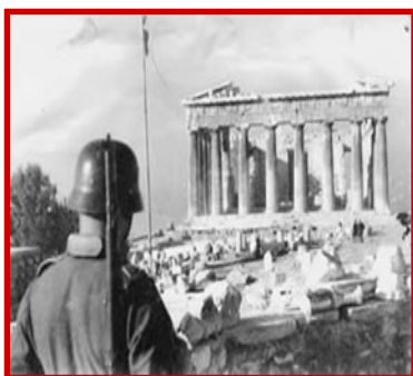
Κατοχή, Αθήνα: Οι Γερμανοί στην Ακρόπολη.

Στις 28 Οκτωβρίου 1940 η φασιστική τότε Ιταλία κήρυξε τον πόλεμο στην Ελλάδα. Μετά από αντίσταση από τη μεριά της χώρας μας που κράτησε πολλούς μήνες, την άνοιξη του 1941 της επιτέθηκε και η σύμμαχος της Ιταλίας, η ναζιστική Γερμανία. Παρά την αρχική αντίστασή της, η Ελλάδα τελικά ηττήθηκε και καταλήφθηκε από τους Γερμανούς, τους Ιταλούς και τους συμμάχους τους Βούλγαρους