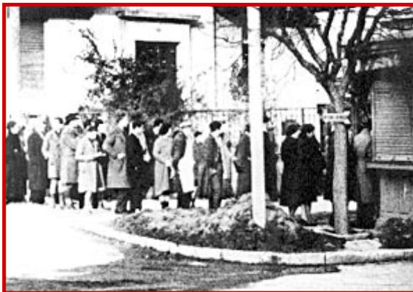
Κατοχή, Αθήνα. Ουρά για συσσίτιο.

Άλλος πολύ σημαντικός λόγος ήταν ότι οι περισσότερες μεταφορές στην Ελλάδα γίνονται από τη θάλασσα, με προορισμό τον Πειραιά και τα νησιά. Κατά τη διάρκεια όμως του πολέμου, οι Άγγλοι που ήταν αντίπαλοι των Γερμανών και των Ιταλών δεν τους επέτρεπαν να κινούνται